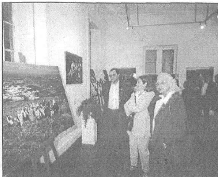
La exposición recoge momentos claves en la vida de la agrupación.