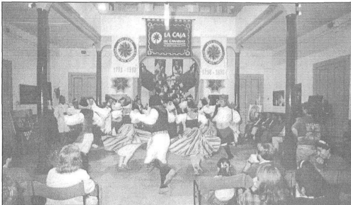
La Agrupación en plena actuación.