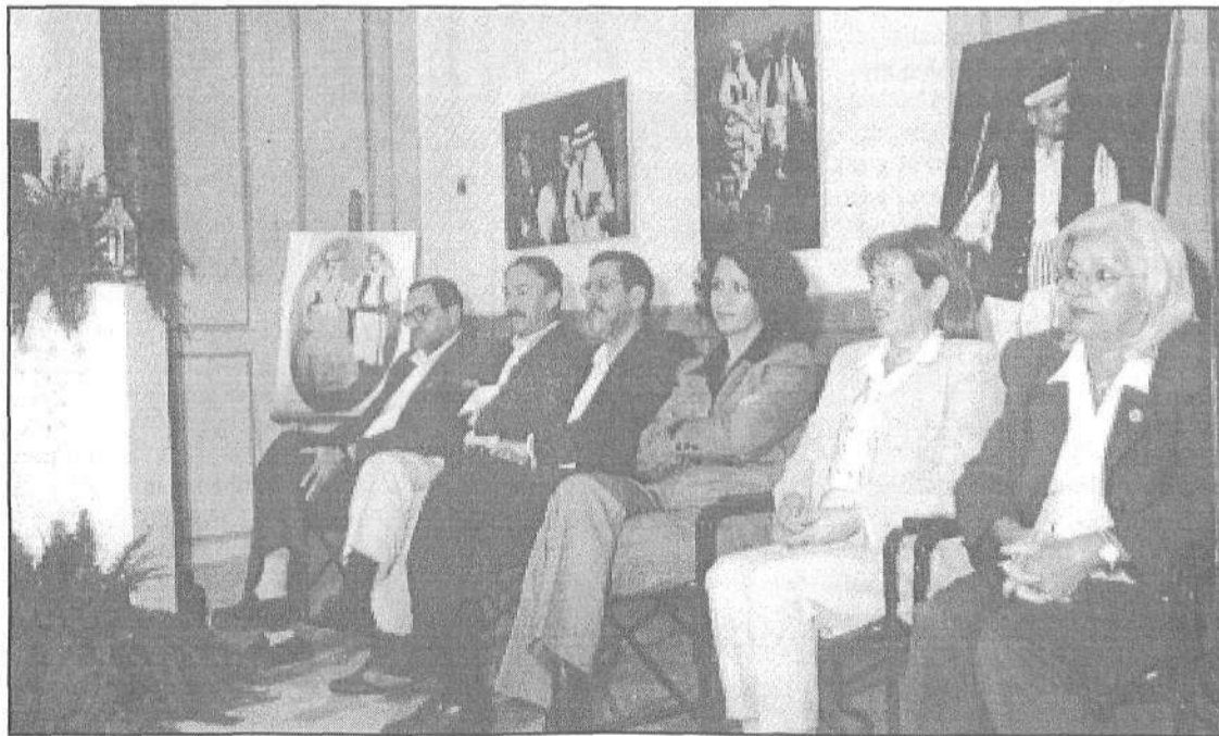
El grupo de gobierno del ayuntamiento de Arrecife estuvo presente en una exposición tan importante.