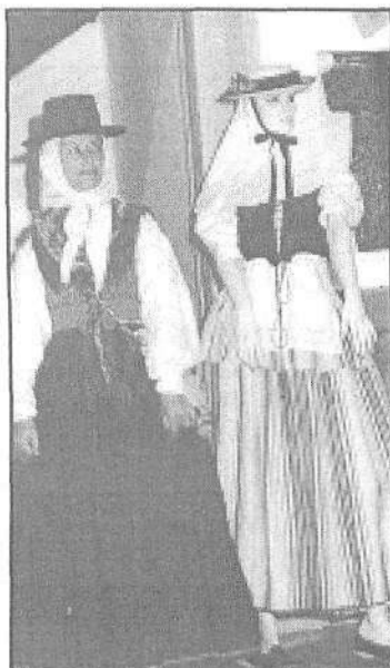
Los trajes más tradicionales son el espejo del paso del tiempo.

“Taifa y Candil” y han recibido el premio “Haría 96” concedido por el ayuntamiento norteño en reconocimiento a la labor de difusión cultural realizada por el grupo.