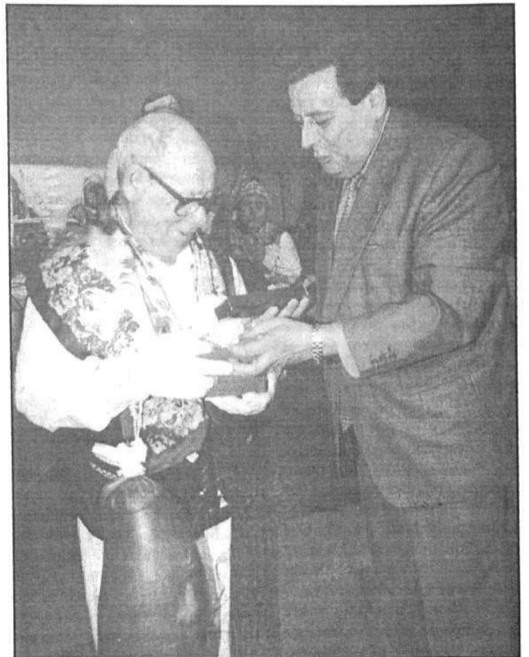
El presidente del Cabildo le hizo entrega de una serie de regalos como reconocimiento a su labor por el folclore.