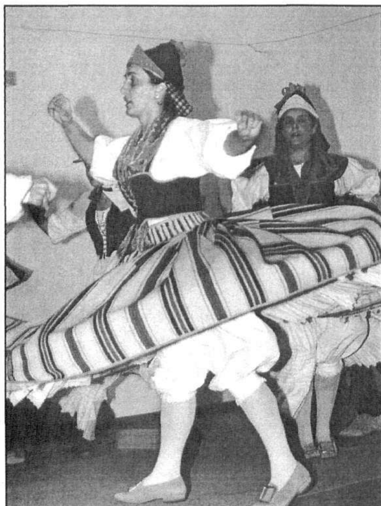
Danzas tradicionales lanzaroteñas.