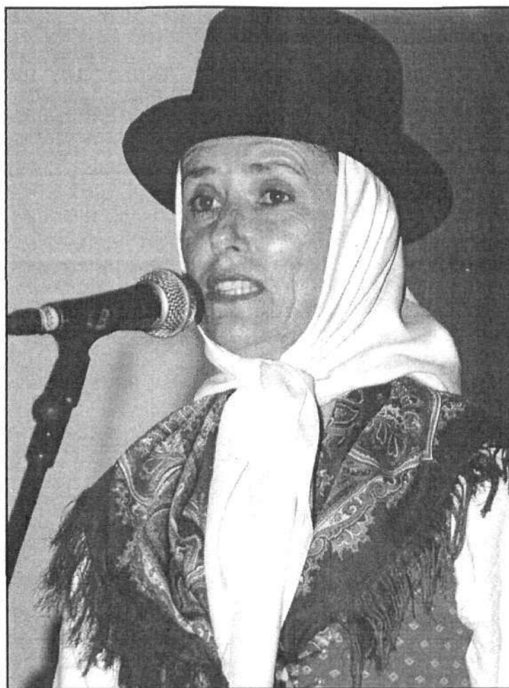
Una de las galardonadas con motivo de la muestra de estas fiestas.