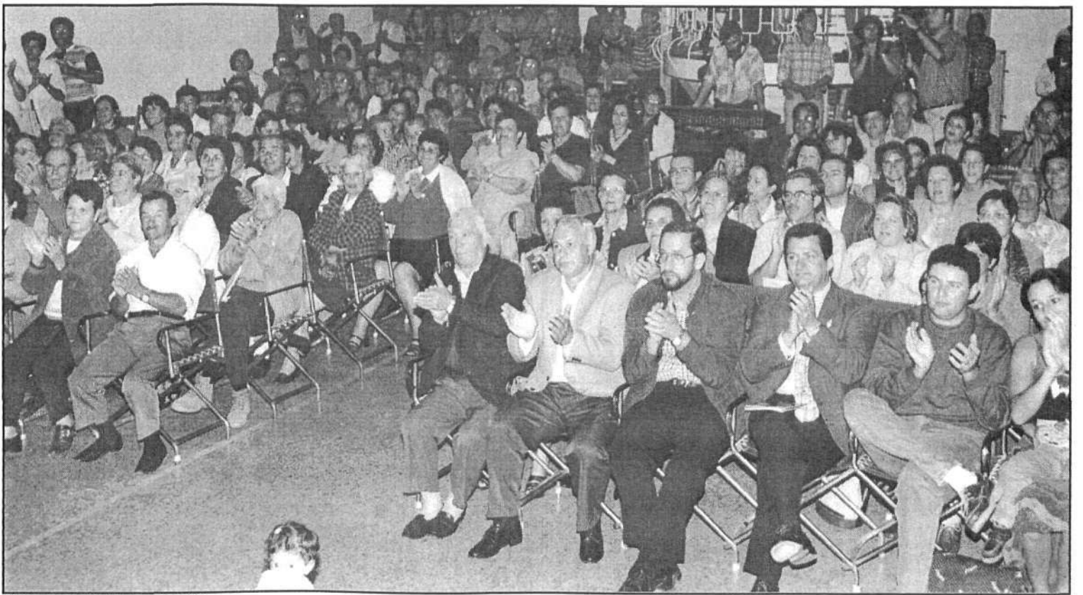
Vista general de la inauguración.

El pasado jueves comenzaron las Fiestas de San Juan en el municipio de Haría, en cuyo programa destacó la inauguración de la muestra gráfica de vestimentas tradicionales de Lanzarote, evento que fue completado con música y danzas isleñas. Esta muestra podrá ser observada en el Centro Socio Cultural La Tegala de Haría hasta el próximo día 25 de junio. El ambiente festivo estuvo presente durante toda la velada inaugural, durante la cuál se pudo admirar la vestimenta correspondiente a los aldeanos del siglo XVIII y XIX, con toda la singularidad de los mismos, entre la que destacaba la monterra, o la mantilla de balleta blanca (pieza muy común en todas las islas). Lanzarote se caracteriza por ser la única isla del archipiélago cuyos trajes tradicionales combinan mantilla y monterra, si bien lo más característi-