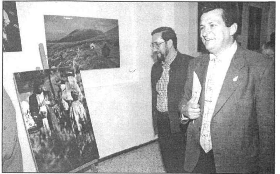
El alcalde de Haría observando uno de los cuadros de la exposición.