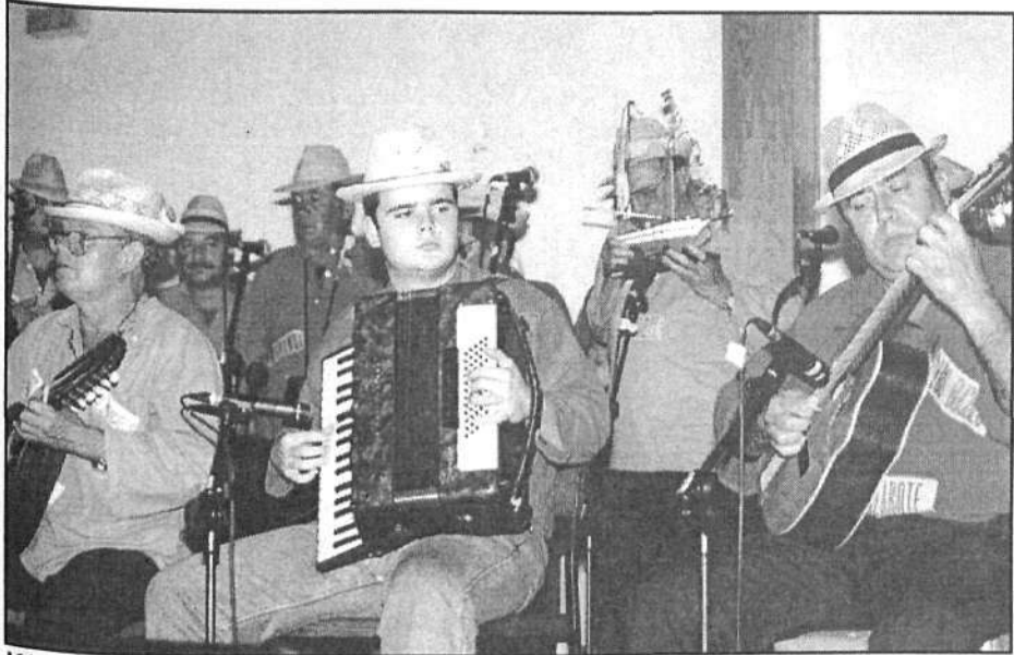
Músicos amenizando la inauguración de la muestra gráfica de vestimentas tradicionales.