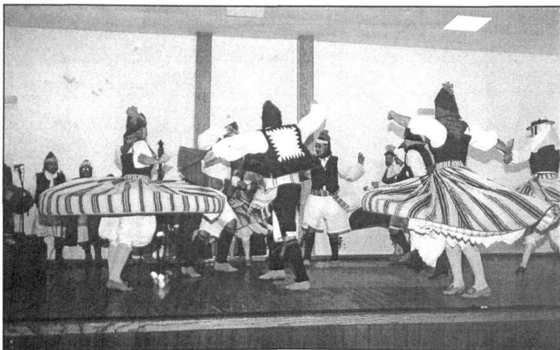
Un momento de la representación de danzas tradicionales lanzaroteñas.