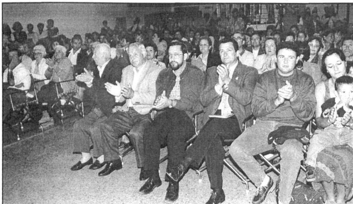
Vista general del público asistente a los cantos y danzas tradicionales.

También por aquél entonces era típico el llevar amarrado un pañuelo bajo la barbilla, y utilizar también pañuelo de hombros