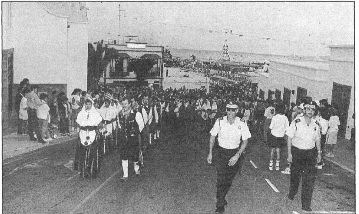
La Rondalla San Antonio de Tías acompañó a la Virgen del Carmen en la procesión terrestre.

Con todo ello se dan por finalizadas las fiestas de Puerto del Carmen correspondientes al presente año.