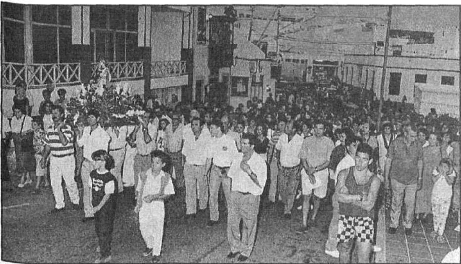
La procesión terrestre, celebrada el domingo, tuvo una gran participación de gente.