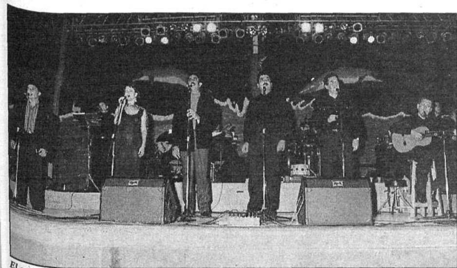
El concierto de Mestisay fue de los más esperados.