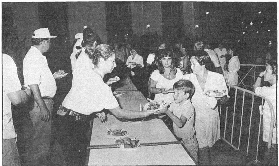
La noche del viernes, con el sancocho, fue la que más éxito obtuvo.