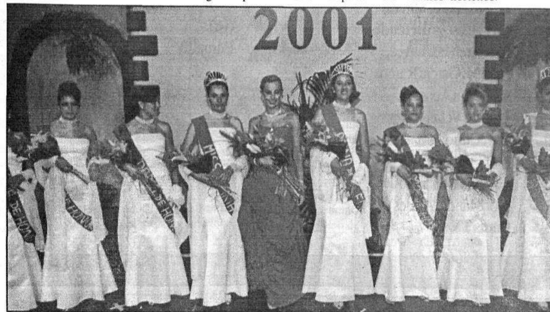
Todas las premiadas se mostraron entusiasmadas ante los galardones recibidos.

que, una vez más, cautivó los aplausos y la admiración del numeroso público que abarrotaba la plaza de Haría. Una vez terminada su actuación, los miembros del Show Espiral tuvieron que volver a salir al escenario requeridos por las ovaciones de los vecinos norteños.