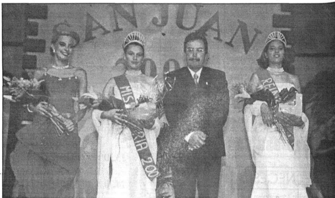
La Miss Haría y la Reina de las Fiestas de este año posaron junto al alcalde del municipio norteño.

Tras el desfile volvía a presentarse ante los asistentes la segunda parte del Show Espiral