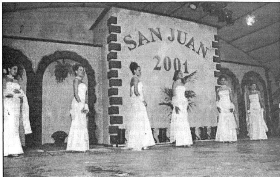
Vestidas de blanco y de largo, las aspirantes mostraron su elegancia ante el jurado.