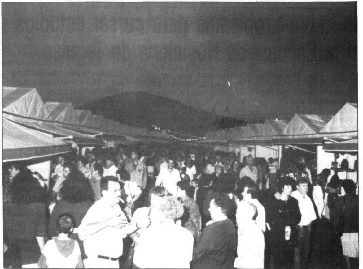
Los artesanos quedaron muy satisfechos con la acogida que tuvo la feria

La Consejera de Cultura del Cabildo, Chana Perera, fue la encargada de la entrega de diplomas a los artesanos del telar, del cuero, de los quesos, de la talla de piedra, de la madera, del vino, de la cerámica, y en definitiva a todos aquellos que desde todas las islas acudieron a Mancha Blanca para hacer posible que la artesanía siga teniendo su lugar entre las tradiciones y costumbres de la isla.