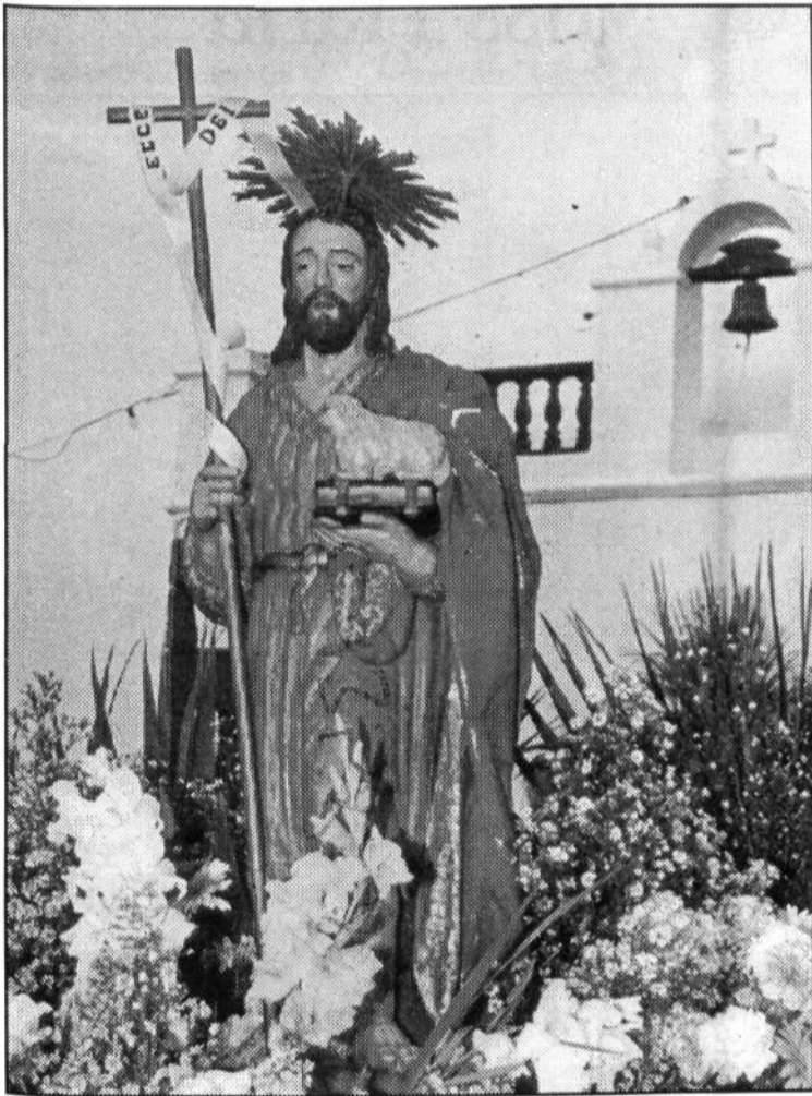
San Juan presidió en todo momento la Romería que se celebró en su honor.