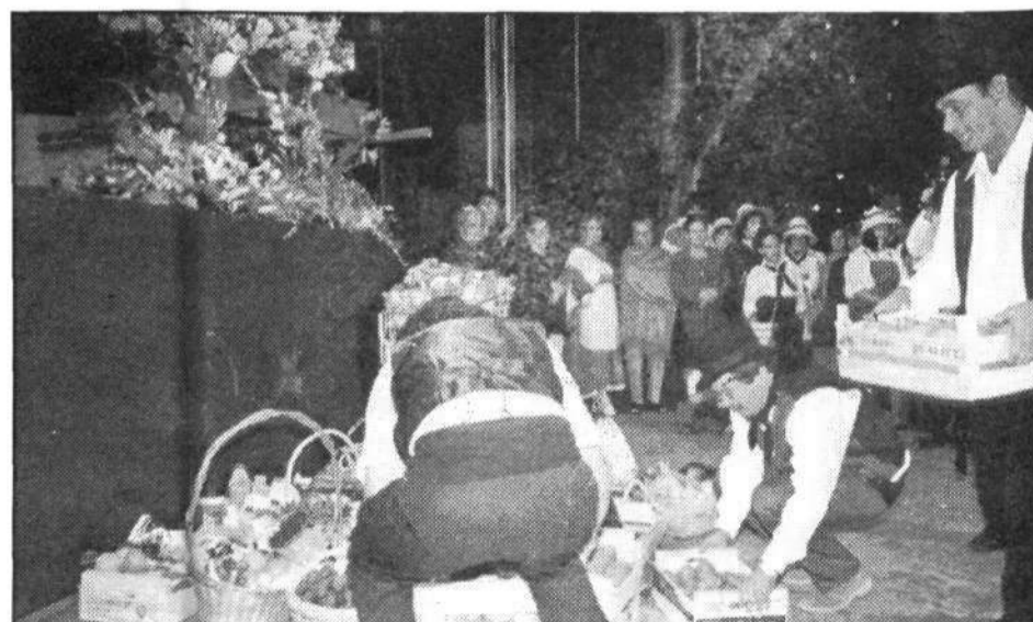
El Ayuntamiento de Haría realizó su ofrenda al santo patrón del municipio.