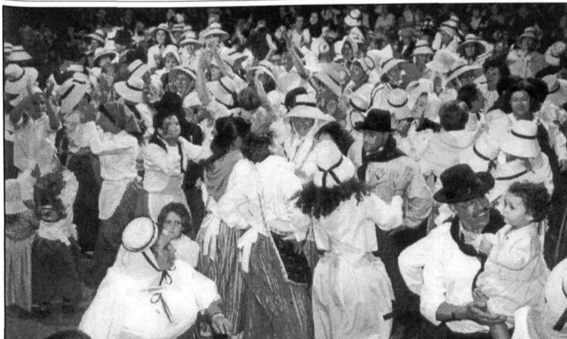
Cientos de romeros disfrutaron del Baile de los Magos.