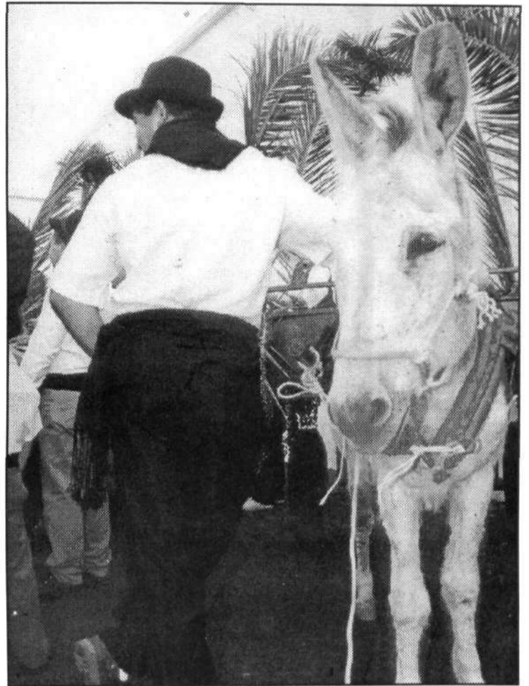
Burros, carros engalanados y camellos no podían faltar en la romería de Haría.