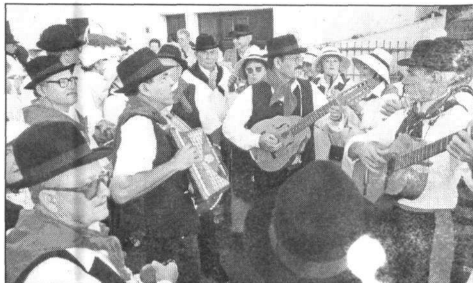
Varias agrupaciones folclóricas de la Isla acudieron a la cita tradicional en el municipio norteño.