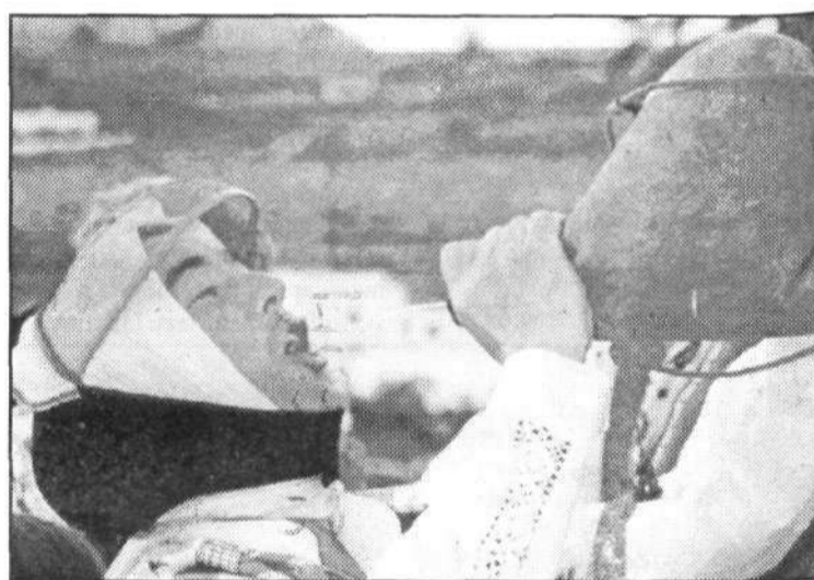
Los productos típicos de la Isla no faltaron en todo el trayecto.

Otra de las Agrupaciones Folclóricas que no dejó de bailar en todo el trayecto fue Corazón Joven, que hizo las delicias de los romeros. La Tercera Edad de Haría, una agrupación que cuenta con unos 22 componentes, también estuvo presente, como no podía ser de otra manera al tratar-