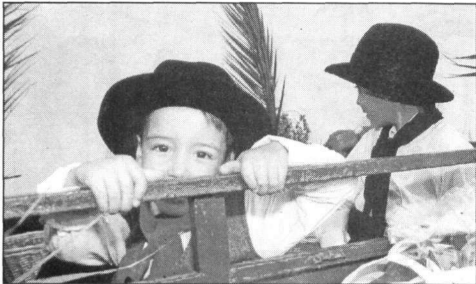
Con solemnidad llevan los más pequeños los trajes tradicionales.

durante el recorrido a las mujeres más bellas del municipio, esto es, a las jóvenes recién elegidas Miss Haría y Reina de las Fiestas de San Juan, que no quisieron perderse uno de los eventos más esperados de las fiestas.