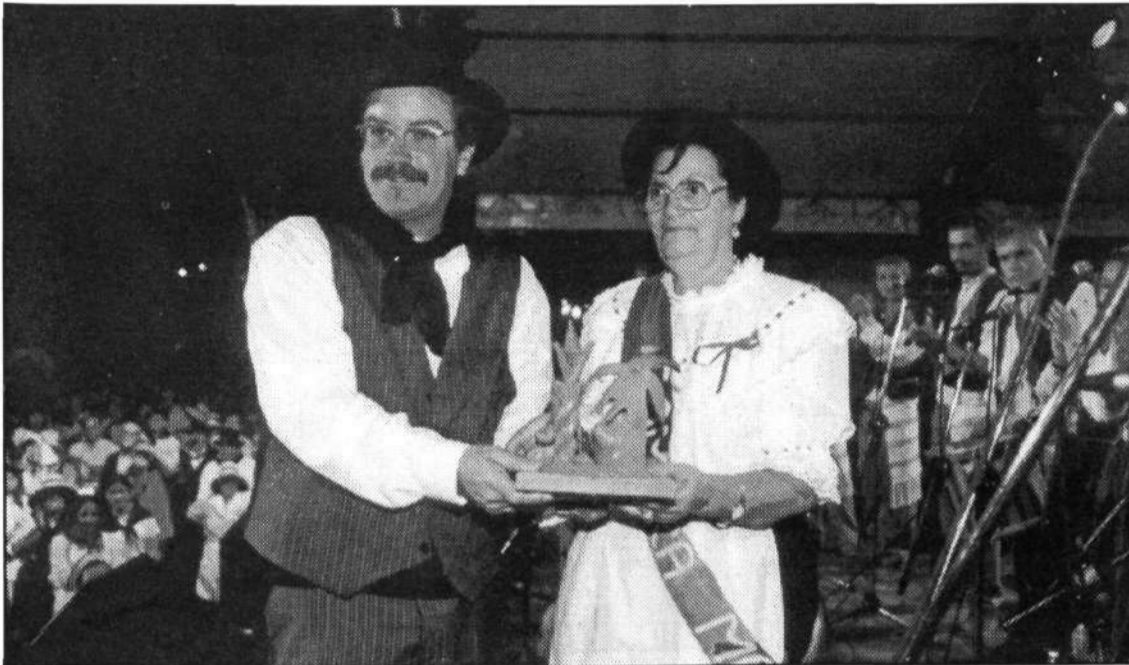
El alcalde entrega su premio a la Romera Mayor.

cantar la misa de San Juan el día grande, el próximo sábado, en la iglesia de Nuestra Señora de la Encarnación.