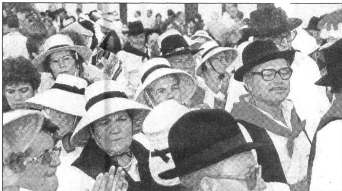
Con música y con alegría transcurrió la comitiva por las calles de Haría.

la Isla y parrandas espontáneas siguieron junto al resto de los romeros a la carroza que portaba el trono del santo patrón. Participaban en esta Romería San Juan 2000 la Asociación de Amigos de la Tercera Edad de Altavista, con una representación de unas 70 personas del barrio que no quieren perderse ningún evento de este tipo. También acudió a la Romería la Agrupación Folclórica la Gran Aldea de Tegui, que con su buen hacer supo divertir al público de Haría cantando todo el repertorio canario.