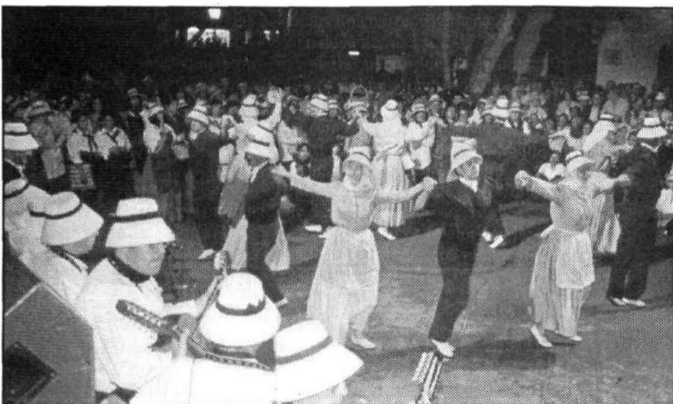
Malpaís de la Corona, como otras agrupaciones folclóricas, bailó en honor a San Juan.

ción muy vinculada al pueblo de Haría aunque sus componentes proceden de diferentes puntos de la Isla, tampoco quiso perderse la Romería de San Juan 2000. Alborada tendrá la responsabilidad de