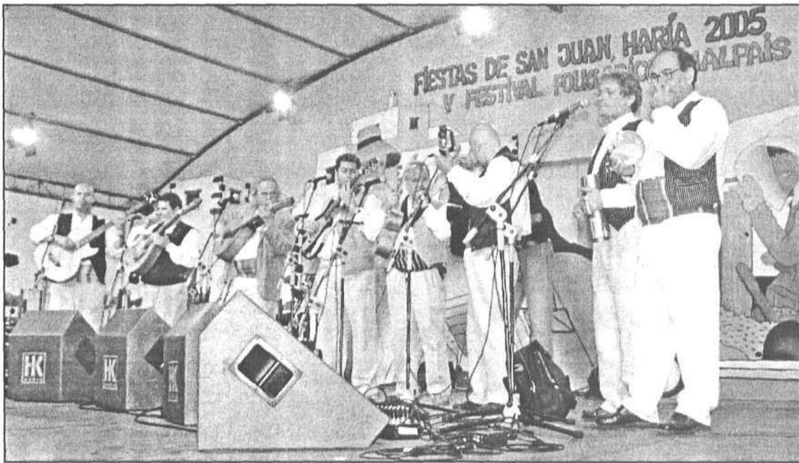
Las agrupaciones ofrecieron un amplio repertorio de música canaria.