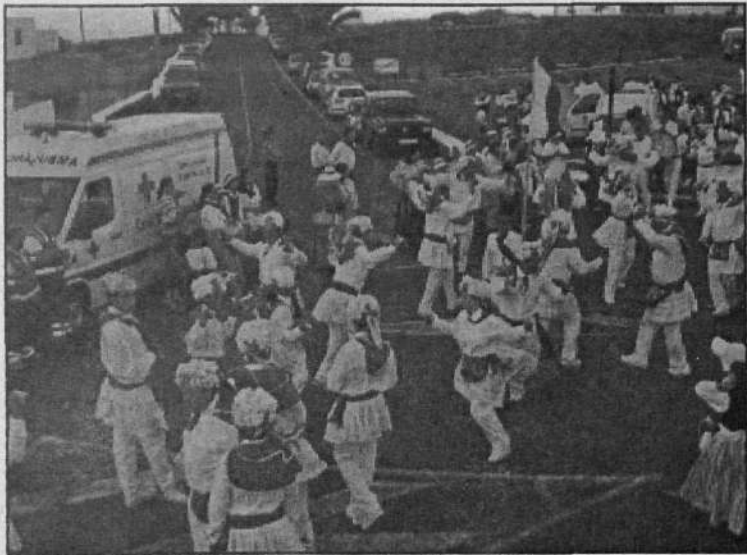
Los bailes y el colorido llenaron las calles del municipio norteño.