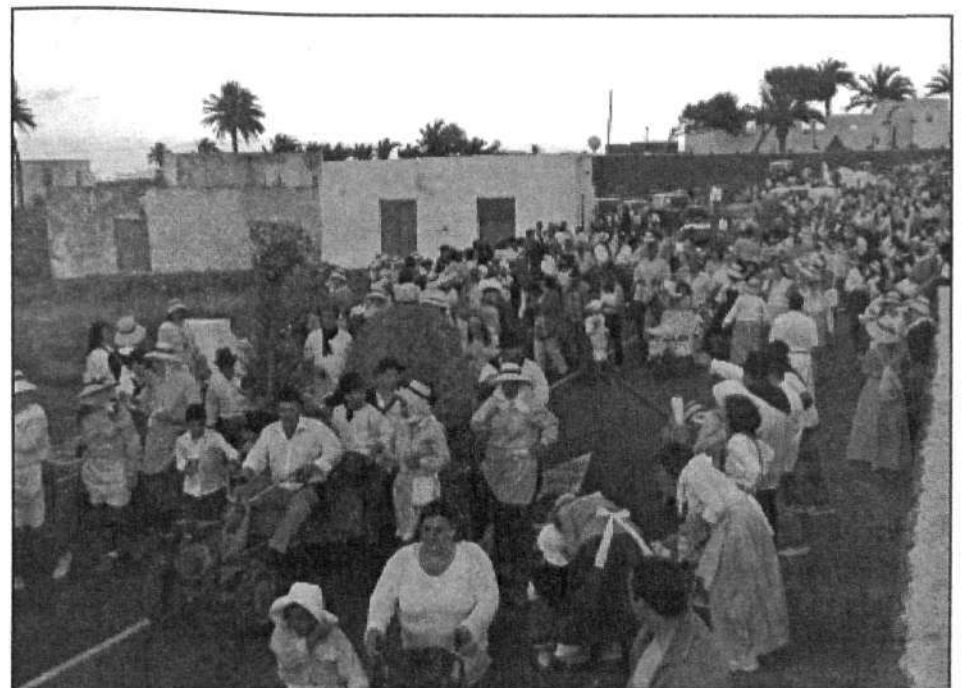
Los romeros llegaron de diferentes pueblos del norte.