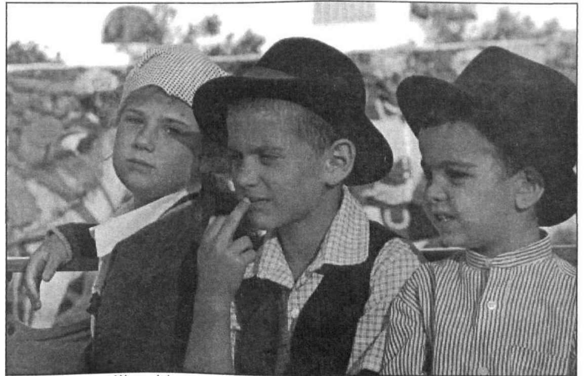
Los más pequeños también se vistieron para la ocasión.