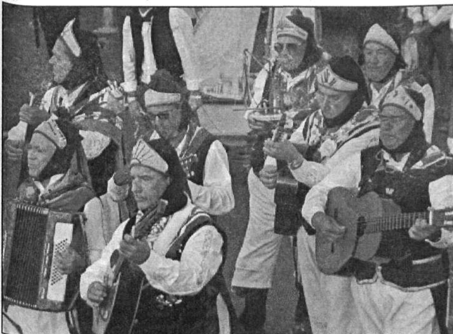
Las distintas agrupaciones amenizaron el recorrido con sus vestimentas y su música.