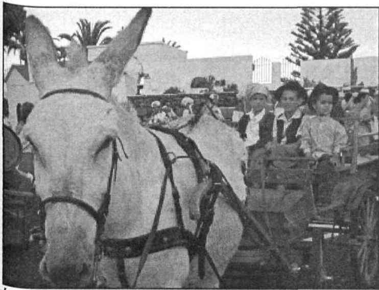
Los niños disfrutaron de lo lindo recorriendo las calles de Haría en los carros.

de medio luto, delantal, pañuelo y sombrero, lo que hizo que el jurado la eligiera como romera mayor de esta edición 2004.