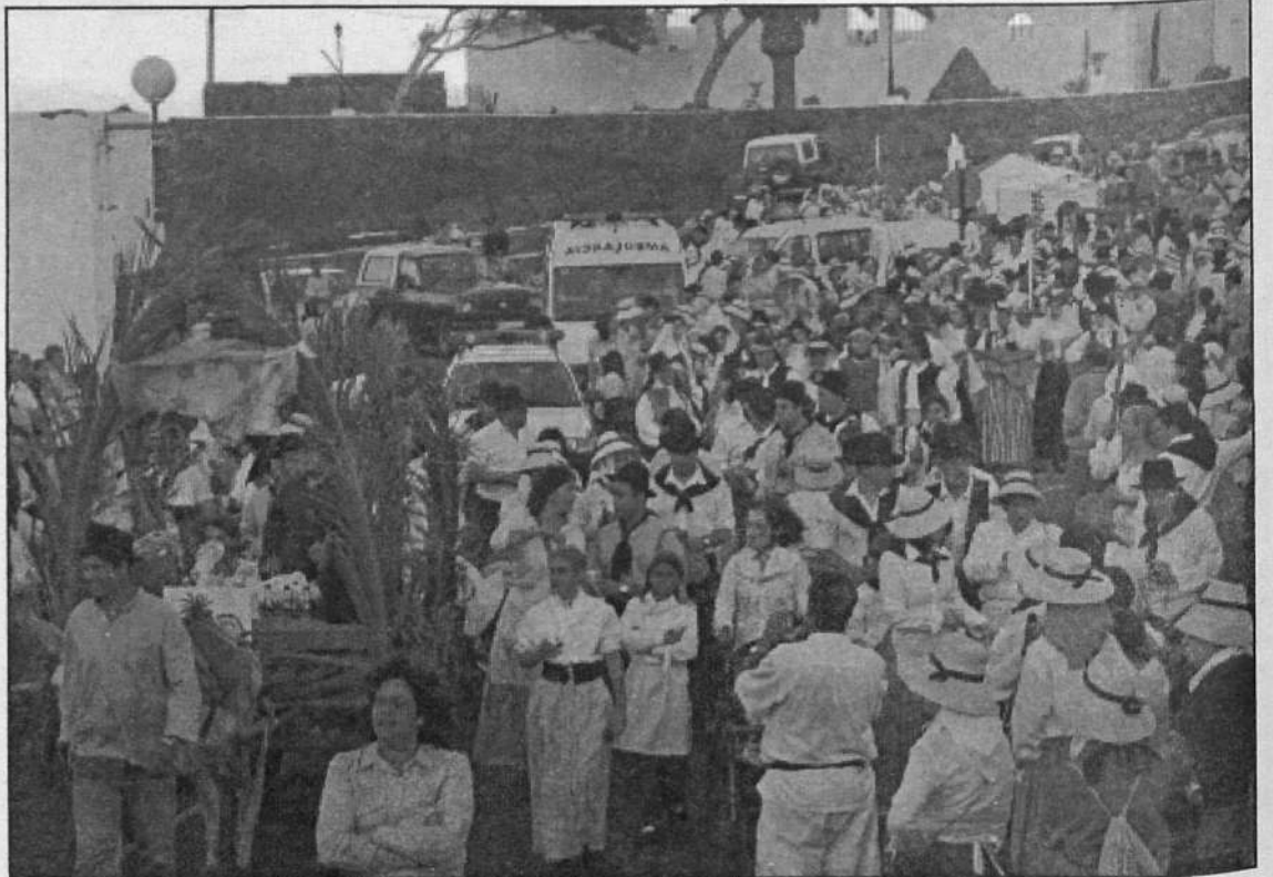
Numerosas personas se vistieron de manera típica en la Romería de San Juan.

El recorrido fue alegre y estuvo amenizado con los sonos de las diferentes agrupaciones, que quisieron dar alegría y tipismo canario a esta fiesta popular. El desfile fue encabezado por la Parranda Marinera Los Buches, que con la alegría que les caracteriza realizó todo el recorrido cantando, bailando y dando buchazos por un lado y por otro. Los miembros iban seguidos de la gente joven del pueblo de Tahiche: la Agrupación Musical Guamaray, habitual en esta Romería. También este año quiso estar allí y cantar en las calles de Haría para ir animando a todos los que quisieron participar. Asimismo, la tercera edad del municipio norteño también estuvo presente con sus canciones y la alegría que desborda. Tampoco la Agrupación Folclórica La Gran Aldea de Tegui se quiso