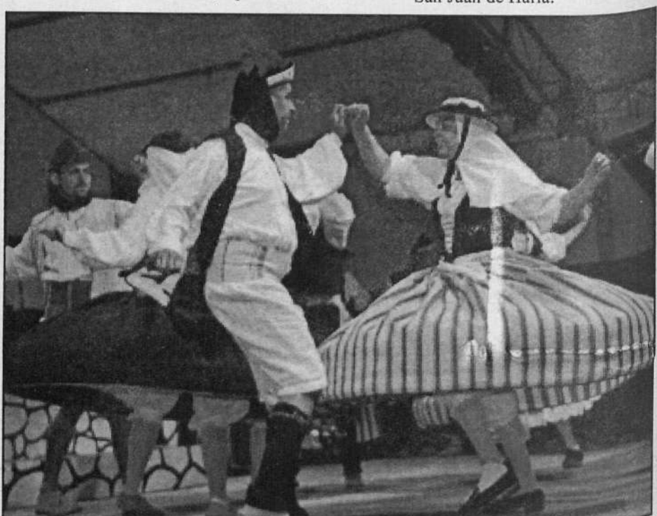
El festival muestra las más diversas manifestaciones folclóricas.