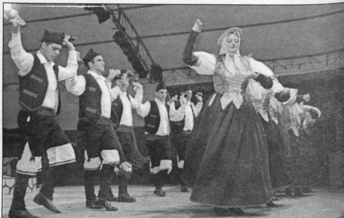
El festival folclórico es uno de los platos fuertes de las fiestas de Haría.

Tras esta actuación, llegaron los anfitriones, la Agrupación Folclórica de Malpaís de la Corona, que comenzó su repertorio con seguidillas seguidas de