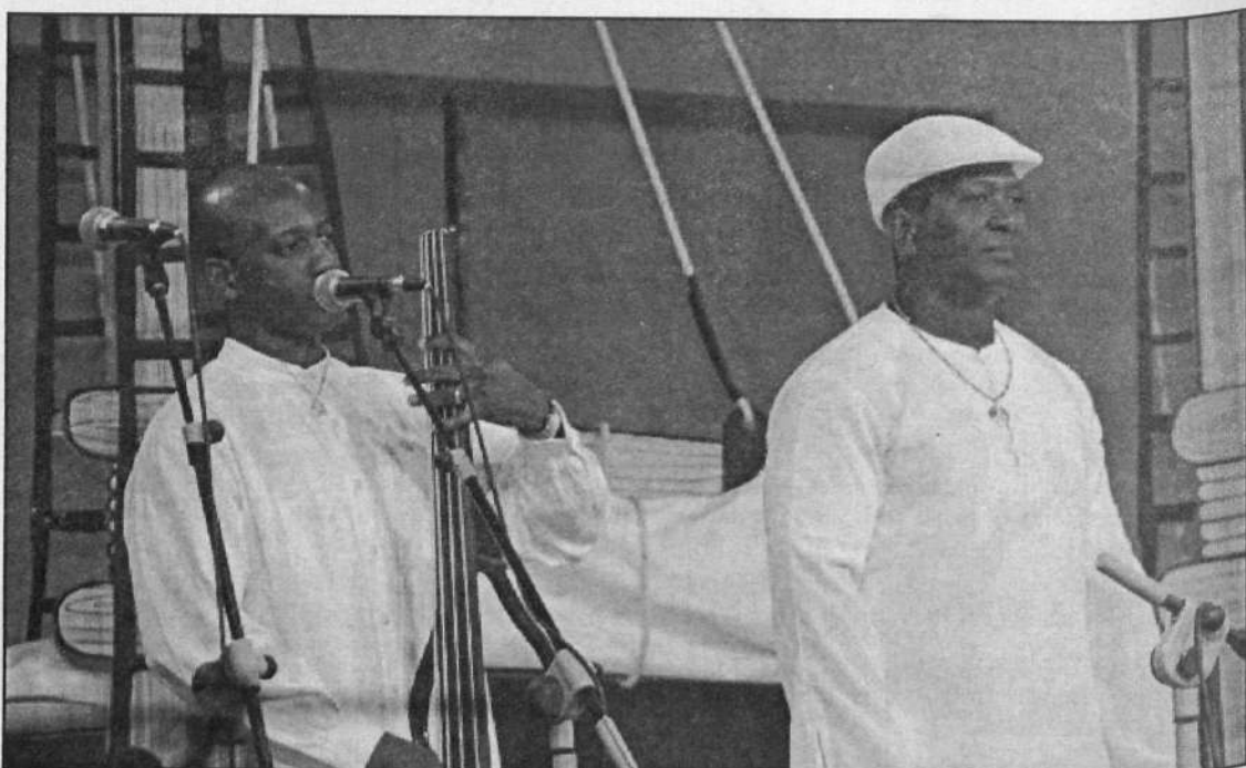
El folclore canario dejó un hueco para la música cubana.