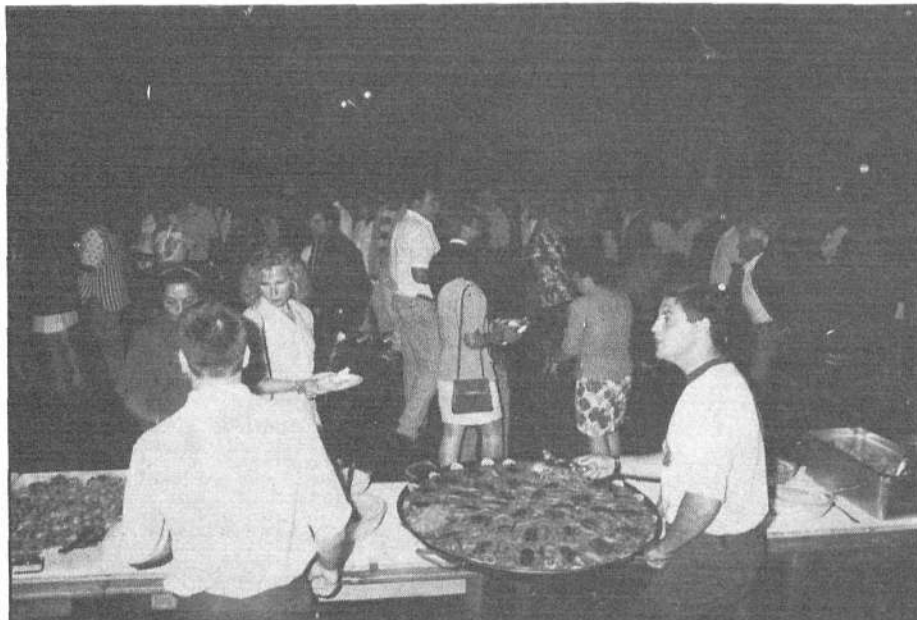
El buffet libre fue el plato fuerte del programa festivo

Finalizado el buffet libre, la fiesta continuó con una verbena amenizada por el grupo "Los Walkinayros", que interpretó numerosas piezas bailables para el disfrute de los vecinos y de todos aquellos que quisieron participar en los actos organizados en honor de San Juan, patrón del Municipio. Para el resto de la semana, se ha preparado un variado programa de actos festivos de todo tipo que combina iniciativas culturales, deportivas y de entretenimiento.