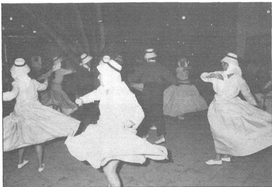
La agrupación folclórica "Malpais de la Corona" ofreció cinco piezas al público