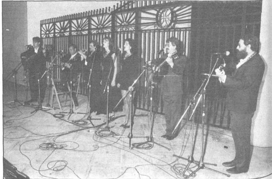
El grupo musical "La Perla" deleitó a los asistentes con sus interpretaciones