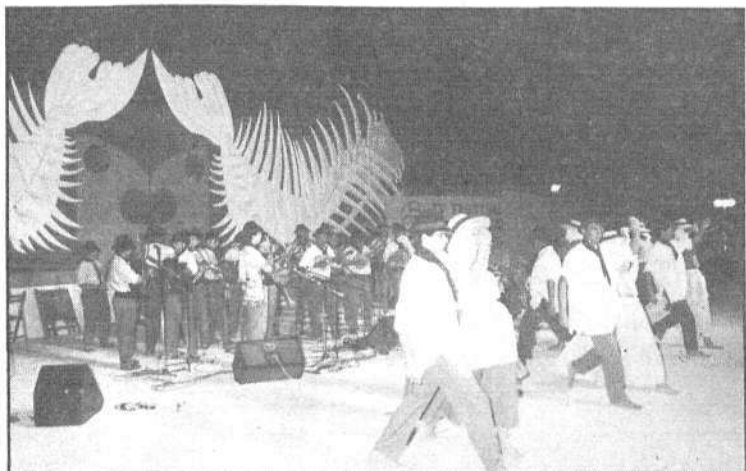
La Agrupación Folclórica "Los Campesinos" deleitó al público con sus bailes tradicionales de gran aceptación

jales y cabilderos, acompañados de sus respectivas, que se arrancaron por rancheras haciéndose llamar "Los Tigres". Incluso recibieron una placa por su laringe de oro (no, de platino no). Por suerte para ellos, se libraron de nuestros fotógrafos.