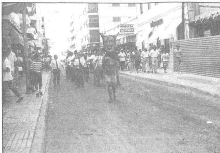
Un diablero cabezudo reparte golosinas a su paso durante el pasacalle de la banda municipal el sábado

La noche. Por desgracia, en los ventorrillos se vieron situaciones en las que un poco del jut-su ése a cargo de las fuerzas policiales no hubiera estado de más. Aunque, bien es cierto, hay "movida" para todos los gustos. Si no, que se lo digan a Rafael, el animador del macroventorri-