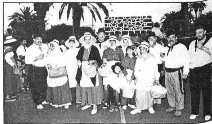
El alcalde de Haría junto a un grupo de amigos en la III Romería de San Juan Bautista.

zó una verbena que estuvo amenizada por las orquestas "Sonora Aganada" y "Walquinairos" y que finalizó a las seis y media de la mañana.