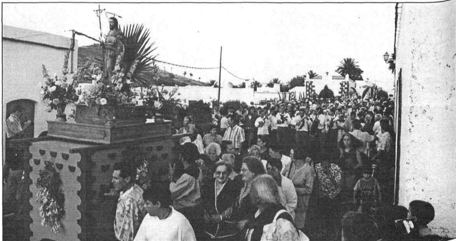
Gran participación en la III Romería de San Juan Bautista de Haría.

El jolgorio no finalizó ya que entrada la noche comen-