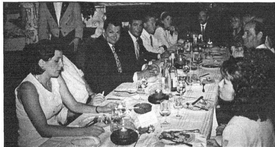
El encuentro de confraternización contó con la asistencia de numerosas personalidades.