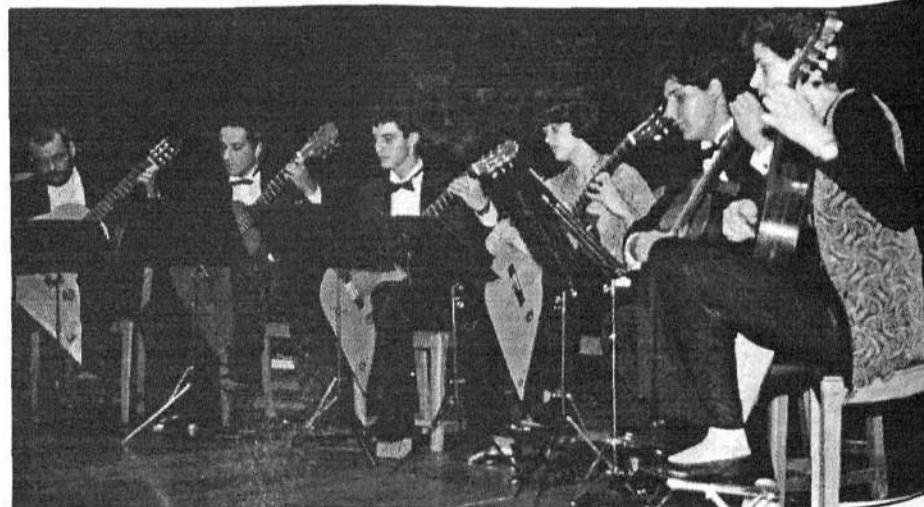
"El sexteto de guitarras de cola" en un momento de su actuación en el encuentro.