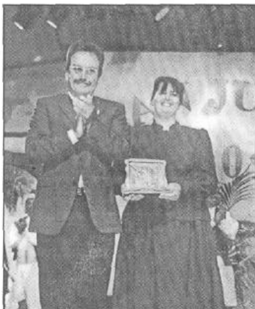
El alcalde de Haría agradeció la participación de todos los grupos.

Llegó el turno de los mayores, "La Pioná" de Fuerteventura, un grupo de hombres y muje-