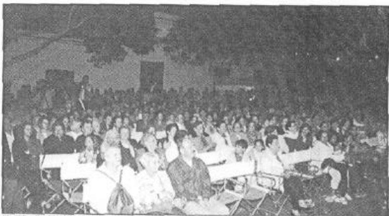
El público llenó la plaza.