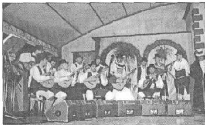
"Los Majuelos" se encargaron de abrir el festival.