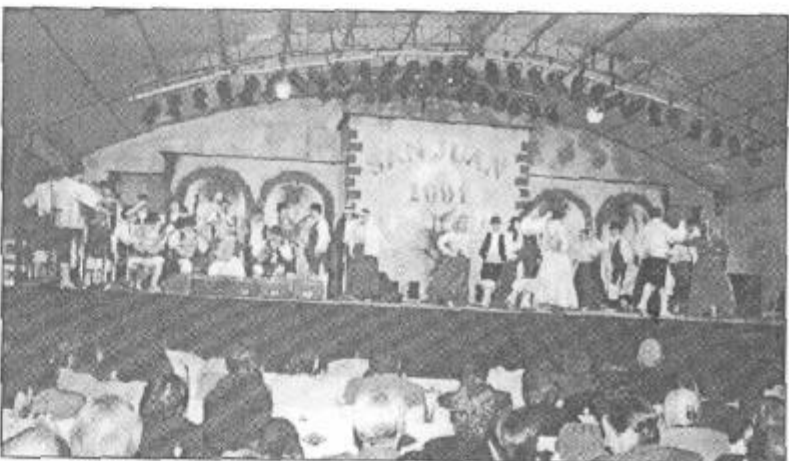
El primer festival de "Malpaís de la Corona" dejó un buen sabor de boca.