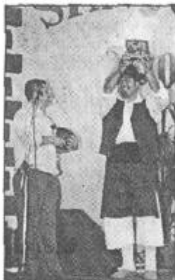
Todas las agrupaciones recibieron su trofeo conmemorativo.

El público pudo así sentirse protagonista de todas y cada una de las actuaciones realizadas tan-