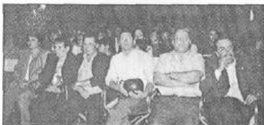
La Corporación no quiso perderse este primer festival folclórico.