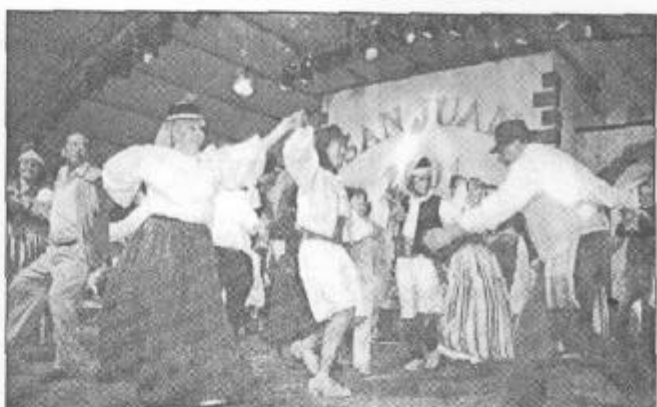
"Malpaís de la Corona" invitó a algunos de sus antiguos componentes a participar.