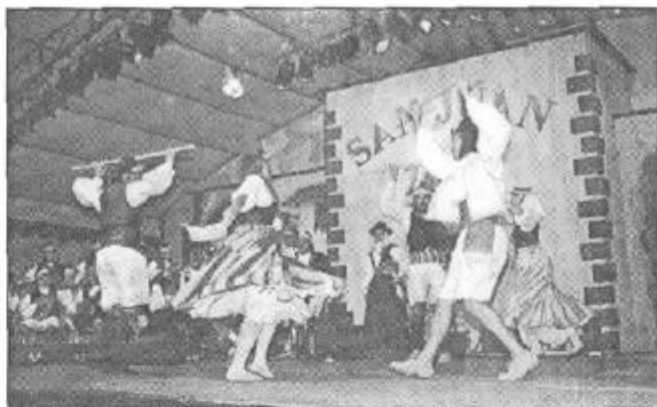
Novedades en "Malpaís de la Corona".