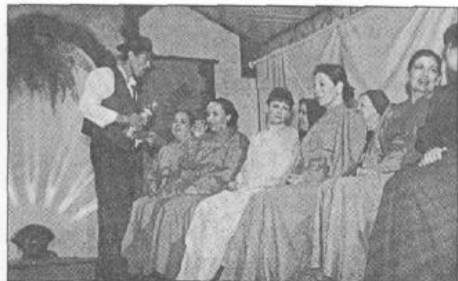
"La Pioná" arrancó la sonrisa del público.