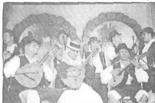
Desde Tenerife, "Los Magueros" lograron el aplauso de los lanzarotinos.

1978, hoy con veintitrés años sobre sus hombros, han recorrido todas las Islas Canarias dejando muy alto el pabellón en todos aquellos lugares en los que han sido requeridos. Este año además irán como embajadores de Lanzarote a las fiestas lustrales de la isla del Hierro, la bajada de la Virgen de Los Reyes.