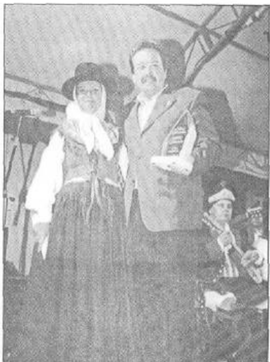
La presidenta de "Malpaís de la Corona" agradeció la colaboración del Ayuntamiento.